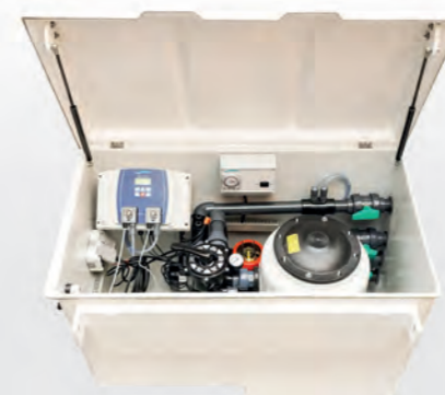
TECHNIKSCHACHT Smart 4/6

Die sparsamen LED's der Firma EVA Optic. Diese haben eine Herstellergarantie von 4 Jahren, sind in jeder Beckengröße verwendbar.