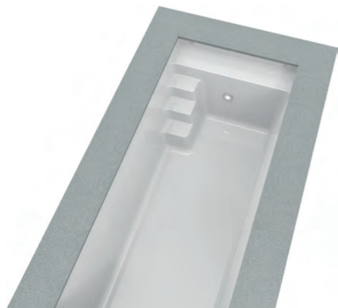
Abbildung: MATCHPOOLS 23 Innenmaß: 2,35 x 5,20 x 1,40 m Aussenmaß: 2,47 x 5,30 x 1,44 m Farbe: Hellgrau, Gewicht: 400 kg

Kleiner Garten - große Freude. Unser MATCHPOOLS Mini Konzept erfüllt auch auf kleinstem Raum den Traum vom eigenen Pool.