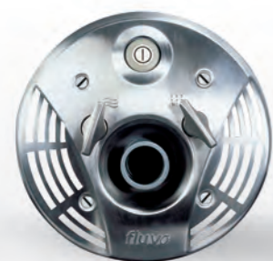
JETANLAGE (Einbausatz + Jetanlage + Pumpe)

Sollte optional eine Jetanlage montiert werden, kann man diese auch in den Technischacht integrieren.