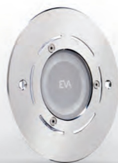
EVA RX (Eco) 6500, Weiß

Er reinigt die Wasseroberfläche und sorgt somit für die optimale Wasserumwälzung und eine perfekte Wasserqualität im Becken. In einem großdimensionierten Sieb werden Schmutzpartikel wie z.B. Blätter sicher aufgefangen.