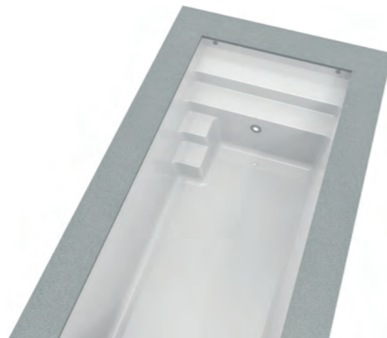
Abbildung: MATCHPOOLS 28 Innenmaß: 2,85 x 6,00 x 1,40 m Aussenmaß: 2,95 x 6,10 x 1,44 m Farbe: Hellgrau, Gewicht: 500 kg