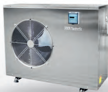
WÄRMEPUMPE BASIC 90, 230 V

Die im hochwertigen Edelstahlgehäuse integrierte, solide Technik sorgt für eine komfortable Verlängerung der Poolsaison von Frühjahr bis in den Herbst. Die integrierte digitale Steuerung erlaubt ein vollautomatisches Heizen und Kühlen ihres Pools. P1 = 1,5 kW bis 30 qm Beckeninhalte