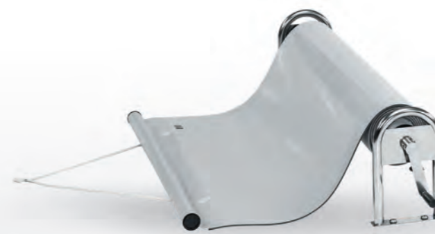
ABDECKUNG (Isola hellgrau + Aufrollvorrichtung Rondalino)

Die im hochwertigen Edelstahlgehäuse integrierte, solide Technik sorgt für eine komfortable Verlängerung der Poolsaison von Frühjahr bis in den Herbst. Die integrierte digitale Steuerung erlaubt ein vollautomatisches Heizen und Kühlen ihres Pools. P1 = 1,5 kW bis 30 qm Beckeninhalte